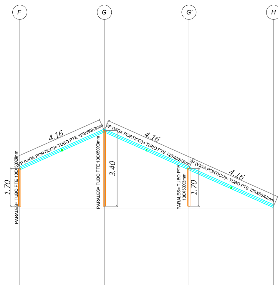
VISTA EN PERFIL CUBIERTA